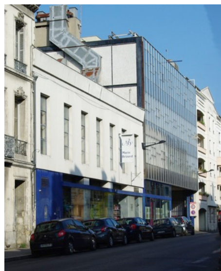
L'usine Marie Brizard avant travaux